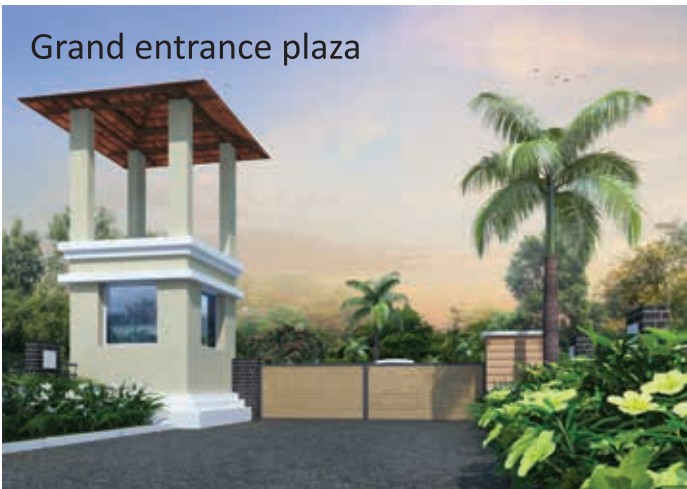
Grand entrance plaza